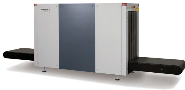
OUVERTURE DU TUNNEL (LXH) : 550 x 850 mm (21.7 x 33.5 in.)

AVEC UNE OUVERTURE DE TUNNEL HAUTE ET UN CONVOYEUR BAS, LE RAPISCAN 624XR EST CONÇU POUR FACILITER LE CHARGEMENT ET LE DÉCHARGEMENT DES BAGAGES EN POSITION VERTICALE.