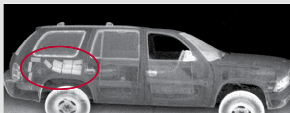
L'image montre des narcotiques cachés