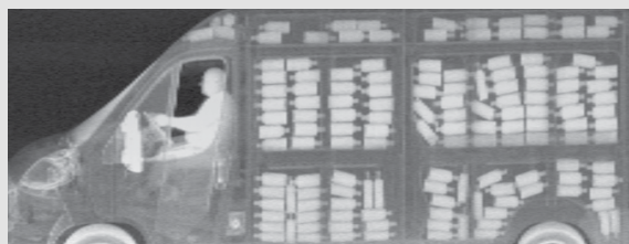
L'image révèle de l'alcool de contrebande, caché pour éviter de payer des droits de douane