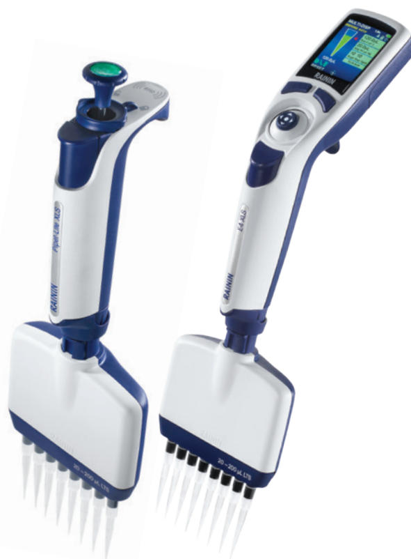
Modèles Pipet-Lite XLS+ et E4 XLS+

Accélérez votre travail sur plaque grâce aux pipettes multicanaux électroniques E4 XLS+ de Rainin. Les modes spéciaux simplifient le mode de transfert des aliquotes, effectuent des dilutions en série et préprogramment des séries de transferts de volume.